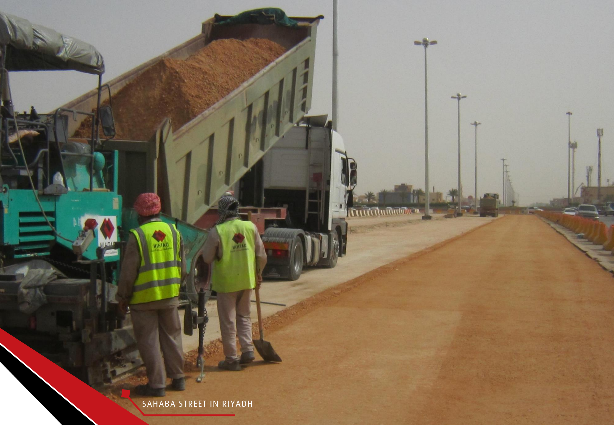
SAHABA STREET IN RIYADH