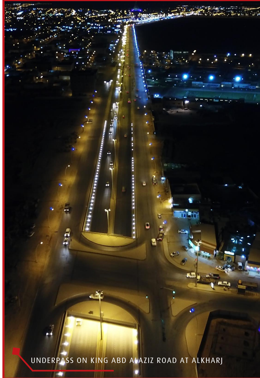
UNDERPASS ON KING ABD ALAZIZ ROAD AT ALKHARJ