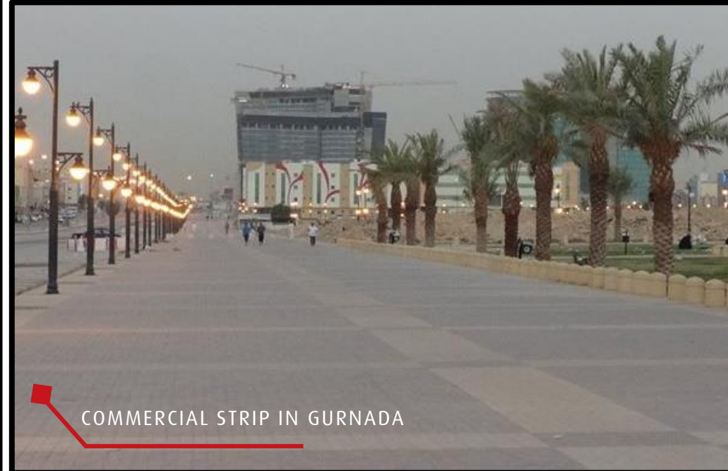
COMMERCIAL STRIP IN GURNADA