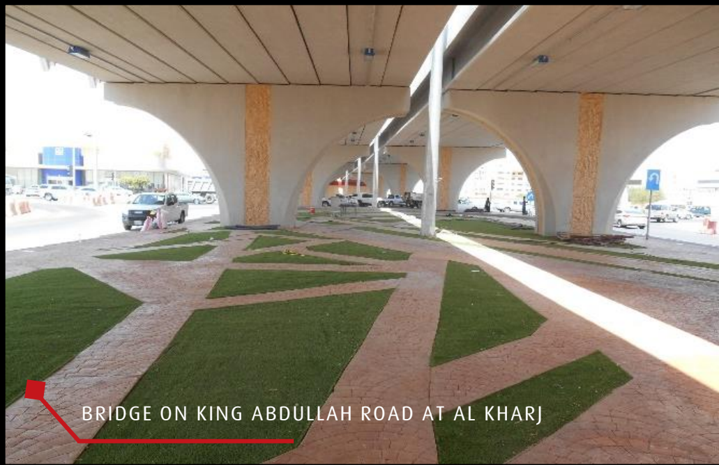
BRIDGE ON KING ABDULLAH ROAD AT AL KHARJ