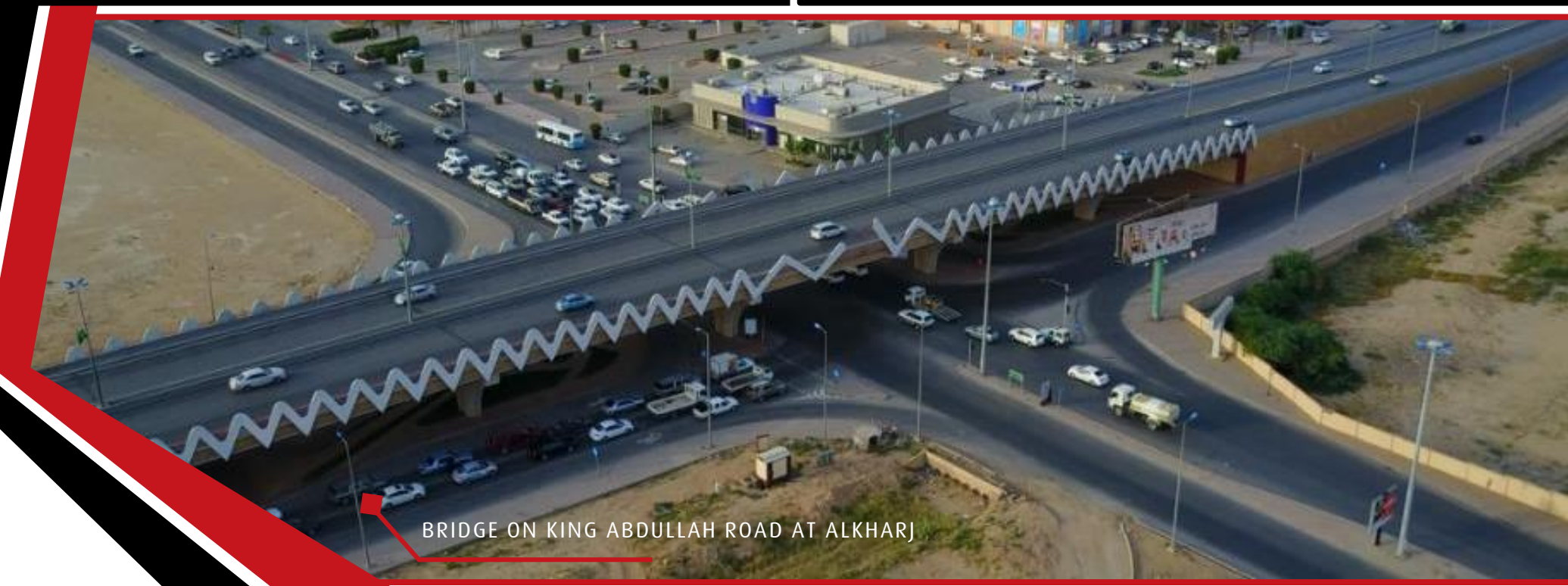
BRIDGE ON KING ABDULLAH ROAD AT ALKHARJ