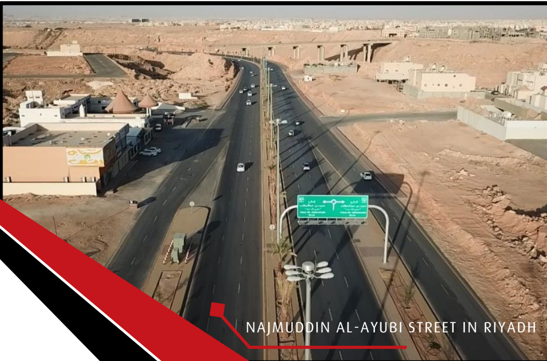
NAJMUDDIN AL-AYUBI STREET IN RIYADH