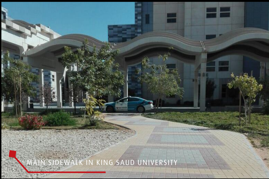
MAIN SIDEWALK IN KING SAUD UNIVERSITY